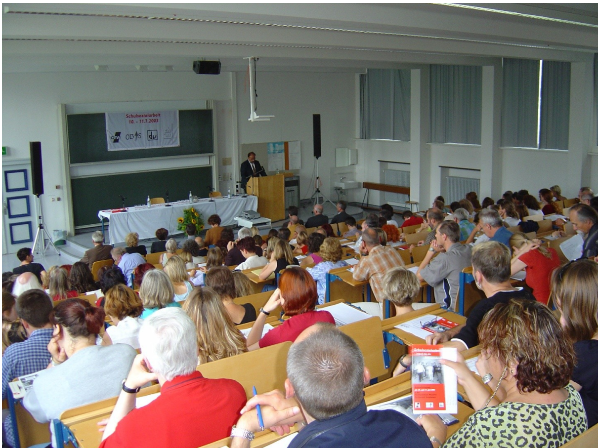
Abbildung 1: Erster Bundeskongress Schulsozialarbeit an Hochschule München 2003