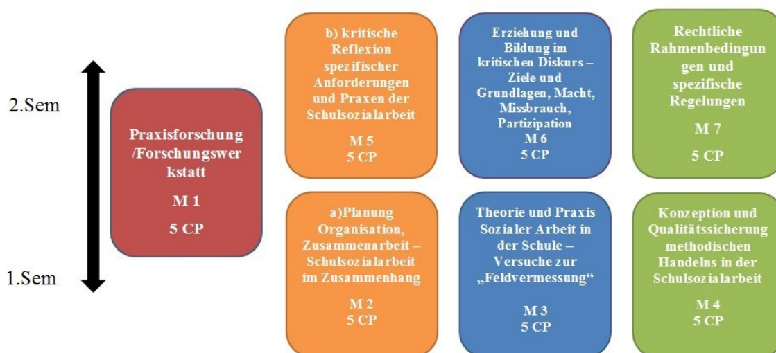
Abbildung 3: Aufbau des Masterstudienganges Schulsozialarbeit an der Katholischen Universität Eichstätt/ Ingolstadt - Interdisziplinärer Masterstudiengang. Hauptfach: Schulsozialarbeit (mindestens 30 ECTS-Punkte), Eichstätt, 2016.

So gab es zunächst an der Technischen Hochschule Nürnberg - Georg Simon Ohm, Fakultät Sozialwissenschaften, der Ev. Hochschule Dresden Soziale Arbeit und sodann an der Hochschule Frankfurt am Main, Fachbereich Soziale Arbeit und Gesundheit, intensive Bestrebungen und Vorarbeiten, Schulsozialarbeit in einem Hochschulstudiengang zu etablieren und akademisch zu sichern. Aufgrund der Unterstützungsangebote aus der beruflichen Praxis (z.B. LAG Schulsozialarbeit Bayern, LAG Schulsozialarbeit Sachsen, Amt für Jugend, Familie und Bildung der Stadt Leipzig, Soziale Dienste Berlin-Brandenburg, Friedrich-Ebert-Stiftung) sowie der vielen förderlichen Entwicklungsprozesse wuchs bei den Initiatoren und Veranstaltern die Erkenntnis, sich bundesweit zu einer BAG Schulsozialarbeit des Fachbereichstages Soziale Arbeit (FBTS) zusammen zu schließen. Man wollte sich zum einen intensiver austauschen, voneinander lernen, sich gegenseitig unterstützen und im Interesse der gemeinsamen Sache die Erfolgchancen der Etablierung von Schulsozialarbeit als Regelinstanz erhöhen. Somit wurden diese Ziele nach mehreren vorbereitenden Arbeitstagen und Sitzungen, auf denen das „Qualifikationsprofil Schulsozialarbeit“ Gegenstand ausführlicher Erörterung war, am 03.12.2009 auf der Mitgliederversammlung des FBTS an der Katholischen Hochschule Mainz vorgestellt, diskutiert und einstimmig ohne Stimmenthaltung verabschiedet.