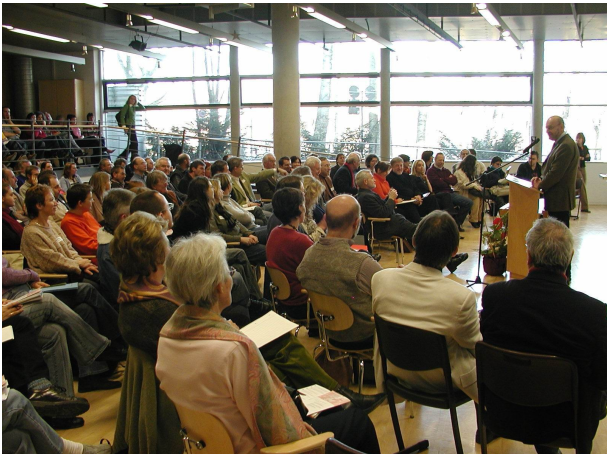
Abbildung 2: Erster Landeskongress Schulsozialarbeit Bayern an der Technischen Hochschule Nürnberg 2005

Obwohl es immer wieder besondere und zugleich zu würdigende Ausnahmen gibt, ist dies unter den gegenwärtigen Rahmenbedingungen beruflicher Praxis - z.B. die verbindliche Einbeziehung und Beteiligung von Schulsozialarbeiterinnen und Schulsozialarbeitern an verantwortlicher Führung, Leitung und Entwicklung der Schule - keine realistische Option. Denn die akademische Distanz zur Lehramtsausbildung ist nach wie vor groß. Diesbezüglich ist nicht nur aus der Sicht der Schülerinnen und Schüler und deren Erziehungsberechtigten fachlich Abhilfe geboten.