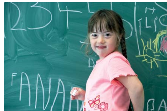
Der Abbau von Barrieren – auch in der Schule – ist ein Schlüssel zur „Enthinderung“ der Gesellschaft

Wer behindert wird, kann an Staat und Gesellschaft nur eingeschränkt partizipieren, seine Rechte also nicht in gleichem Maße nutzen wie nicht-behinderte Menschen. Dagegen richtet sich die UN-BRK. Sie verpflichtet den Staat dazu, die gleichberechtigte, barrierefreie Rechtsausübung jedes Menschen trotz individueller Beeinträchtigung zu ermöglichen. Deshalb heißt es in Artikel 1: